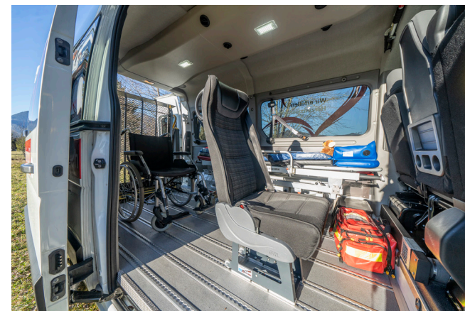
Die Innenausstattung des Hospizmobils mit moderner, funktioneller Technik

Unser Hospizmobil ist mit modernem medizinischem Equipment ausgestattet, um den Fahrgästen bestmögliche Versorgung und Komfort gewährleisten zu können.